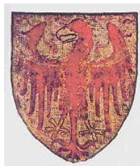
Abbildung: Tiroler Adler auf dem Altar des Schlosses Tirol um 1370

Das Land Südtirol führt im Sinne des Artikels 3 des neuen Autonomiestatutes ein eigenes Wappen. Das von der Südtiroler Landesregierung am 30. Juli 1982 einstimmig beschlossene Landeswappen ist durch das Dekret des Präsidenten der Republik vom 21. März 1983 genehmigt worden. Die heraldische Beschreibung lautet: „auf Silbergrund alter roter (Tiroler) Adler, goldbewehrt mit roter Zunge und goldenen Flügelspangen “. Es ist der rote Tiroler Adler aus dem Jahre 1370, so wie er auf dem Altar der Kapelle von Schloss Tirol abgebildet ist.